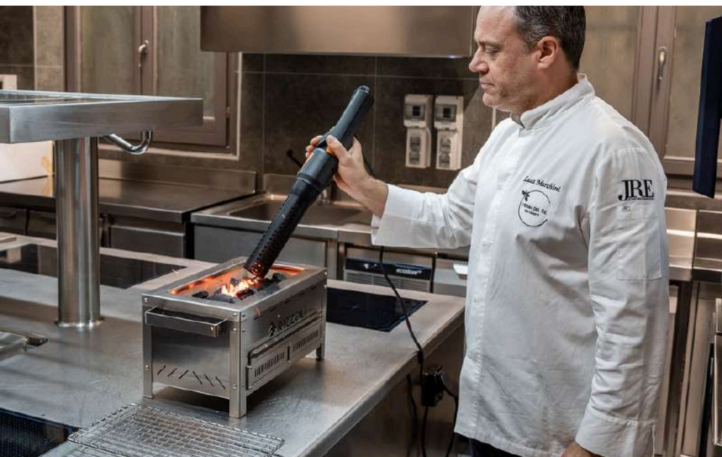
LO CHEF MARCHINI ACCENDE IL CARBONE NELLA GRIGLIA AG GRILL L CON L'ACCENDITORE ELETTRICO ULTRA-VELOCE

L'idea alla base della realizzazione di queste griglie è quella di avere uno strumento di cottura con la brace versatile per finiture e cotture esprese da utilizzare in una cucina professionale. Le griglie si contraddistinguono per una filosofia costruttiva semplice ma allo stesso tempo molto robusta che mette insieme materiali di grande qualità come la pietra refrattaria e l'acciaio inox.